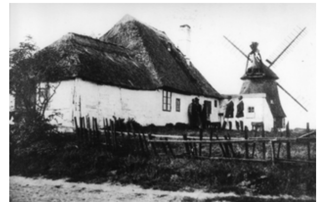
Haus „Steinhütte“, Möhlenbarg (ca. 1900)

Ein kulturhistorischer Rundwanderweg durch das Dorf Tating. Die grünen Dorferzählschilder kennzeichnen besondere Gebäude oder Objekte und geben Einblicke in die Geschichte des Ortes.